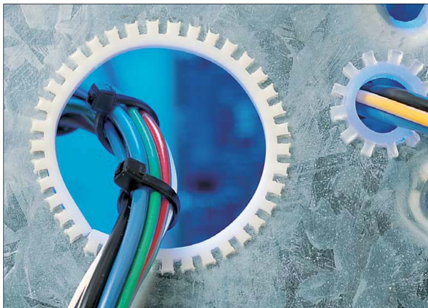
Optimal beskyttelse av kabler og ledninger ved metallkanter.

Flexiform kantbeskyttelse blir benyttet for å beskytte kabler og ledninger som føres gjennom åpninger med skarpe kanter.